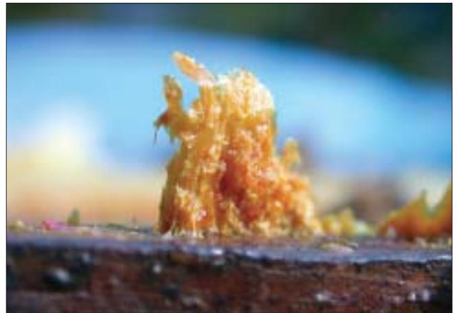
▲ Propolis, eine harzig klebrige Substanz, wie sie sich beim Öffnen von Beuten an den Rändern zeigt.

Für den imkerlichen Hausgebrauch reicht es, wenn man Propolis in möglichst reiner Form, d. h. mit wenig Wachs von Rähmchen oder Beutenteilen, abkratzt. Im größeren Maßstab