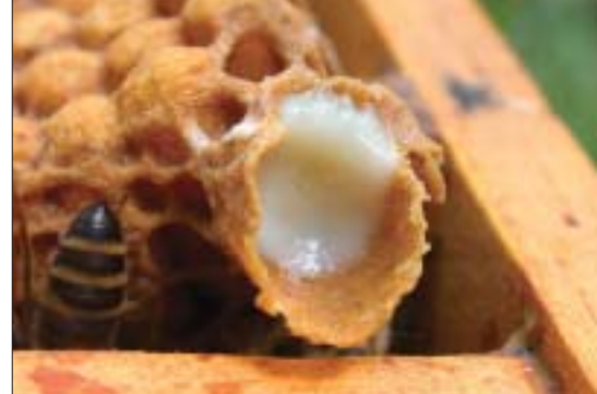
In Völkern mit Schwarmstimmung kann man beim Zellenbrechen das säuerlich und scharf schmeckende Gelée royale kosten.