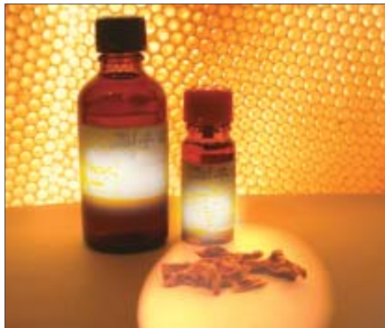
Für den Hausgebrauch kann man Roh-Propolis zu einer Tinktur oder zu Cremes verarbeiten.