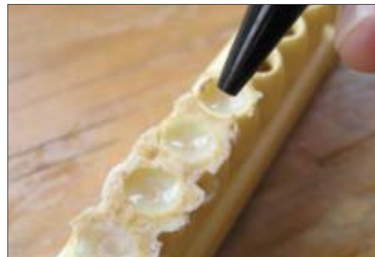
Noch vor dem Verdeckeln werden die Larven entfernt und das Gelée royale abgesaugt.