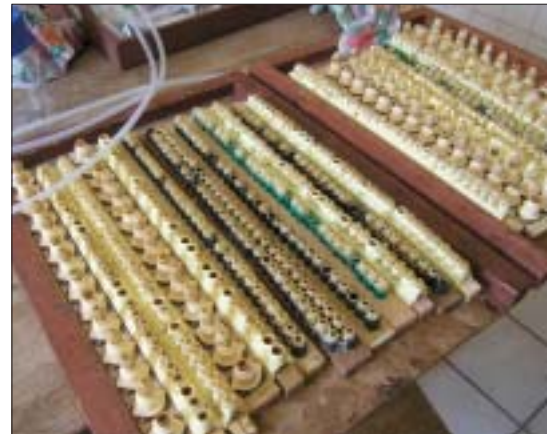
Zur Gelée royale-Gewinnung lässt man die Bienen wie bei der Königinnenvermehrung belarvte Weiselnapfchen pflegen.