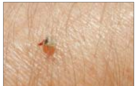
▲ Wenn eine Biene sticht, bleibt der gesamte Giftapparat in unserer Haut und pumpt selbstständig weiter Gift ins Gewebe.

Der Stachel muss immer ► sofort (!) entfernt werden – am besten mit dem Fingernagel herauskratzen.